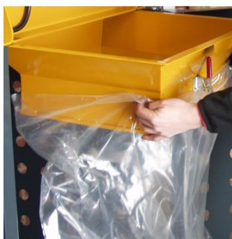
Eenvoudige toegang om de zak te vervangen.